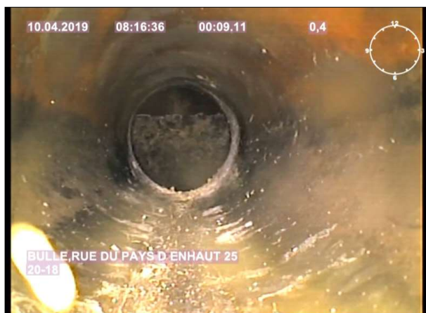
Photo: 2_2A, MPEG #: 1_W8_1004195, 00:00:09 0,4m, Encrassement , de 3 à 9 h.