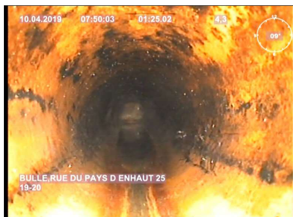
Photo: 1_6A, MPEG #: 1_W8_1004195, 00:01:25 4,3m, Encrassement , de 12 à 12 h.