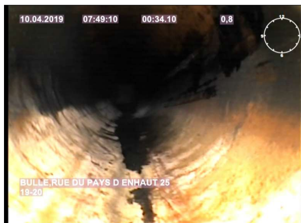
Photo: 1_3A, MPEG #: 1_W8_1004195, 00:00:34 0,8m, Encrassement , de 3 à 9 h.