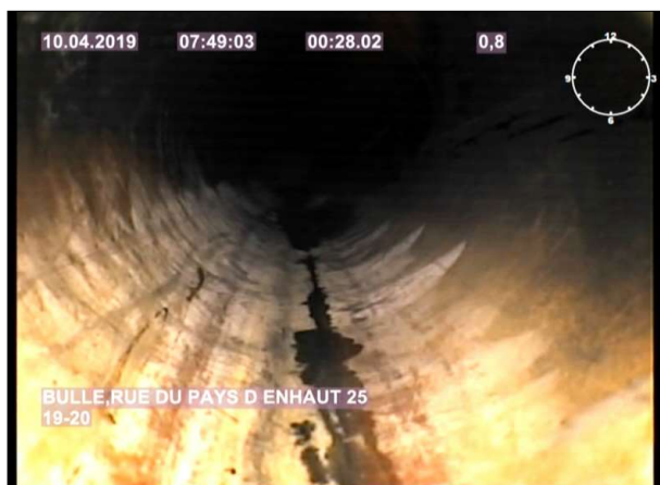
Photo: 1_2A, MPEG #: 1_W8_1004195, 00:00:28 0,8m, Début de l'examen avec une caméra (norme)