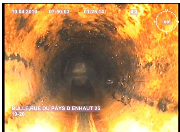
Photo: 1_5A, MPEG #: 1_W8_1004195, 00:01:25 4,3m, Niveau d'eau, effluent trouble